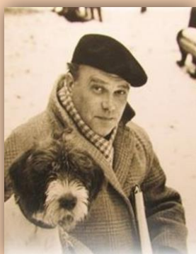
Е. И. Чарушина

Он был посвящён творчеству писателей, которые замечают все необычное и интересное в мире природы. Дети смогли познакомиться с произведениями: