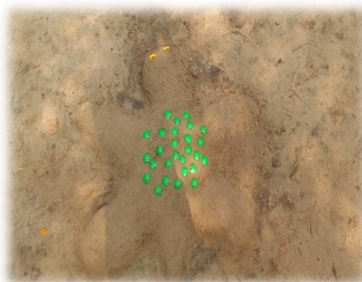
Черепашка – Тортила