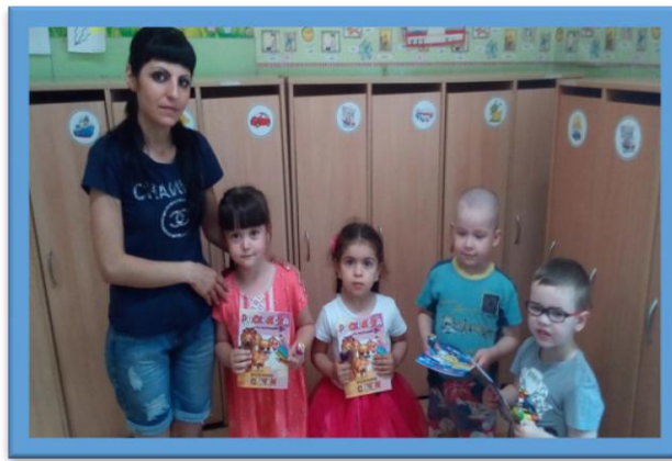
Приготовила: Караханян К.Г.