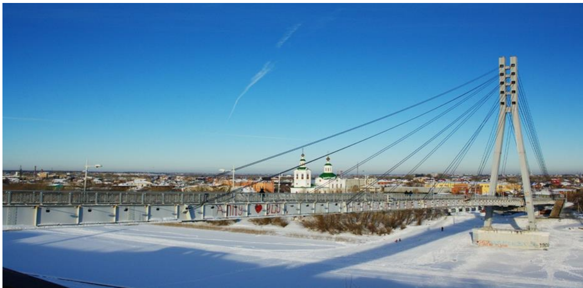
Мой город - Тюмень